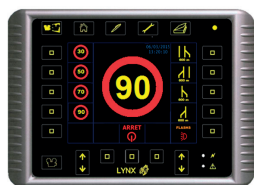
Boîtier de télécommande LYNX